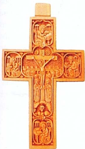
Рад Аранђела Даниловића 2019