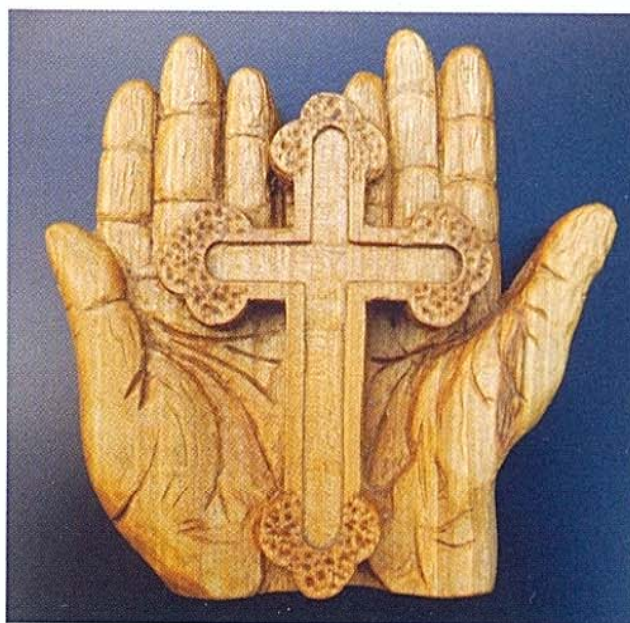
Рад Николе Аранђеловића 2020