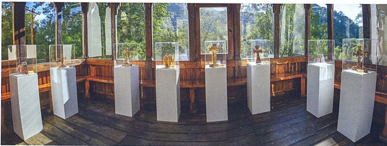
Изложба изабраних крстова на тераси патријарха Павла 2020