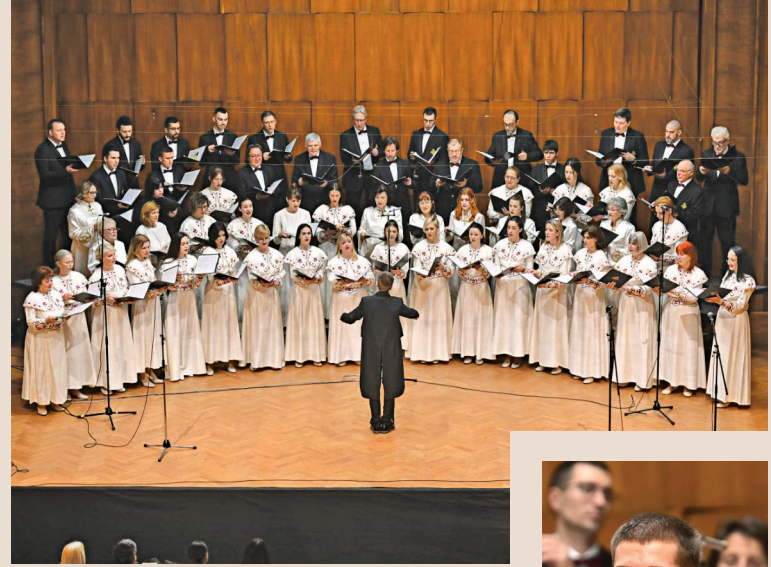
ХОР „ПРВО БЕОГРАДСКО ПЕВАЧКО ДРУШТВО“