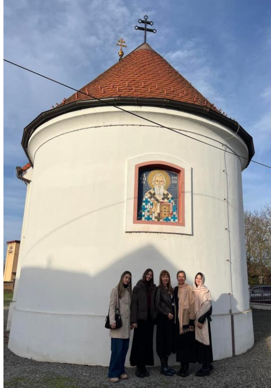
Гимназијалке пред светиоником – Црква Св. Петра и Павла у Кућанцима