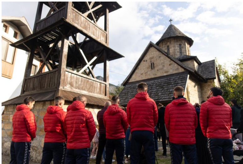
Подмладак ФК „Борац“, на Светој литургији, уочи отварања изложбе Крсторезбарске колоније

Тога дана, након литургије, за трpezом љубави, Агапе, радост делимо и препознајемо се као ближњи: Кућанчани и ми, из Чачка, као и људи са разних наших страна, јер дођу ту и Београђани и Крајишници. Увек су присутни и фудбалери „Борца“ и, што ме посебно радује, сви воле кад гимназијалци (а већ су се нанизале генерације) казују поезију или читају своје записе.